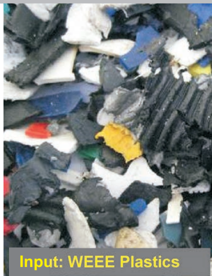
Input: WEEE Plastics